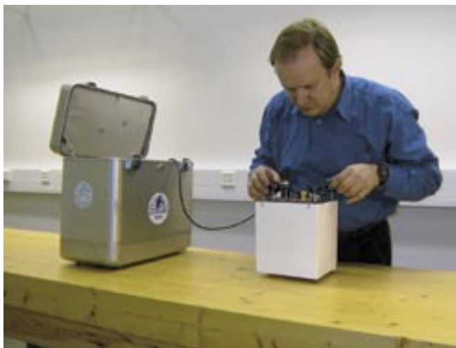
Kuva 2. Mittaus relatiivigravimetrillä.

Teemme tutkimusta ja kehitämme kansallista infrastruktuuria putoamiskiihtyvyyden ja painovoiman mittauksen kaikkia sovelluksia varten (mm. geodesia, geofysiikka ja geologia). Kansallisen painovoimaverkon 30000 pisteen avulla putoamiskiihtyvyys voidaan arvioida ilman uutta mittausta tarkkuudella 0,1 \text{ mm s}^{-2} . Olemme tehneet mittauksia absoluuttigravimetreillä 20 maassa. Toimintaamme ohjaa ISO/IEC 17025 ja ISO 9001 standardien mukainen laatu järjestelmä.