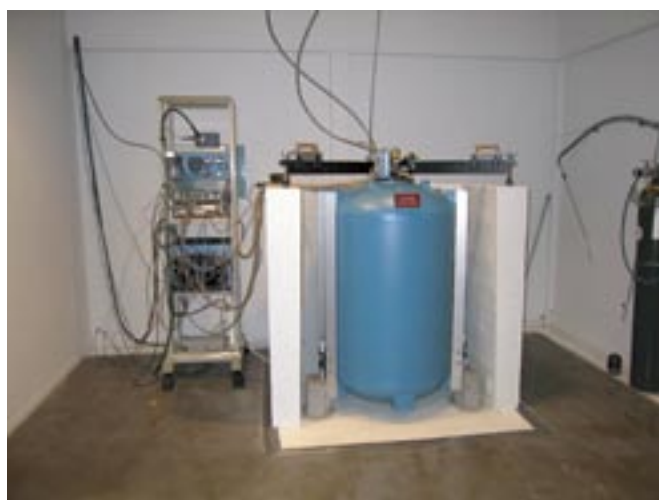
Kuva 4. Suprajohtava gravimetri (Metsähovi, Kirkkonummi) rekisteröi jopa 0,1 \text{ nm s}^{-2} vaihtelut putoamiskiihtyvyydessä.